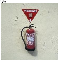
Gambar 4 APAR di Tempat Pengolahan FABA

Selain itu, aspek keselamatan kerja juga menjadi perhatian pada area pengolahan FABA. Penempatan APAR (Alat Pemadam Api Ringan) di lokasi pengolahan menunjukkan bahwa operasional pengelolaan limbah telah dilengkapi dengan prosedur mitigasi risiko yang sesuai standar. Keberadaan APAR tersebut menjadi bentuk pengendalian potensi bahaya yang dapat muncul selama kegiatan pengolahan berlangsung.