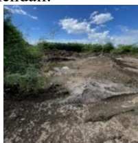
Gambar 2 Ash Yard

lingkungan sekitar. Sistem ini memastikan penyimpanan FABA aman dan terkendali.