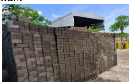
Gambar 3 Kegiatan Produksi dan Pemanfaatan FABA

Hasil pemanfaatan limbah FABA dapat terlihat dari produk paving block yang telah diproduksi. Hal ini membuktikan bahwa FABA sebagai limbah non-B3 mampu memberikan nilai tambah melalui konversi menjadi material konstruksi yang layak digunakan.