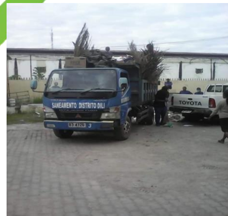
Gambar-3: Armada pengangkut sampah

Sistem pengumpulan sampah di Kota Dili yang masih kurang baik dalam segi metoda pengumpulan sampah dengan gerobak atau motor dengan bak terbuka atau mobil bak terbuka dimana di komplek atau perumahan. Pola pengangkutan yang ada di komplek delta 3 ini memakai truck sampah yang dimana sebenarnya dalam pengangkutan sampah yang tidak teratur membuat penumpukan sampah di komplek delta 3 tersebut menjadi penumpukan sampah yang membuat masyarakat menjadi risih dengan penumpukan sampah yang ada, sampah yang terceceran dan bau dan membuat lingkungan terlihat kurang baik apalagi di sekitar warga. Dimana memberi dampak yang kurang baik bagi kesehatan masyarakat