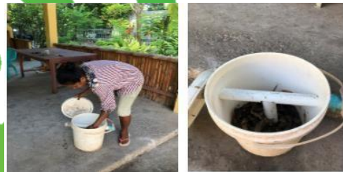
Gambar-5: Pembuatan Kompos

Untuk pengelolaan sampah organik sayur-sayuran setelah dilakukan pemilahan, masyarakat melakukan komposting secara sederhana yang dimana sampah sayur-sayuran dimasukan kedalam drum kompos selama 1 bulan.