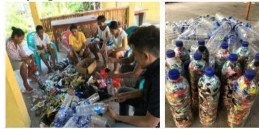
Gambar-4: Pembuatan Ecobrick

sehingga membentuk padatan yang dapat di gunakan kembali menjadi sesuatu yang bermanfaat.