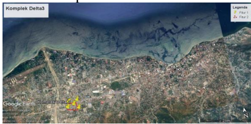
Gambar-1: Lokasi penelitian

dengan mengukur timbulan sampah dari sumber menggunakan metode berat dan metode volume. Pada Gambar-1 dapat dilihat lokasi penelitian :